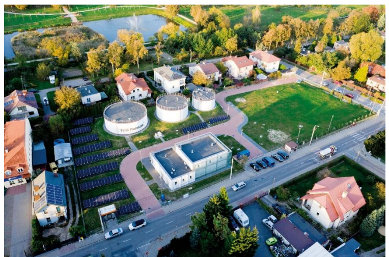
Stacja uzdatniania wody przy ulicy Żeromskiego w Piasecznie.

Na przestrzeni lat Spółka korzystając ze środków własnych oraz unijnych przeprowadziła kilkadziesiąt inwestycji w zakresie rozbudowy infrastruktury wodno-kanalizacyjnej, aby sprostać potrzebom dynamicznie rozwijającej się aglomeracji. Piaseczyńskie inwestycje obejmowały rozbudowę sieci wodociągowej oraz kanalizacyjnej, jak również obiekty stacji uzdatniania wody zlokalizowane w miejscowości Bobrowiec, Piaseczno, Wólka Kozodawska i Złotokłós.