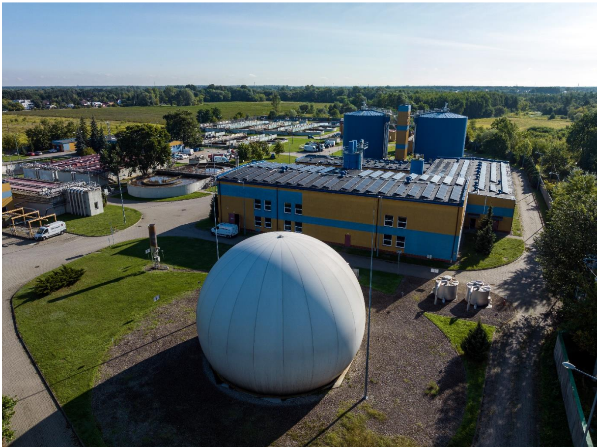
Zbiornik biogazu na terenie oczyszczalni ścieków w Piasecznie, w tle instalacja paneli fotowoltaicznych.

Łączne nakłady inwestycyjne Spółki poniesione w latach 2014-2023 wyniosły blisko 200 mln zł!