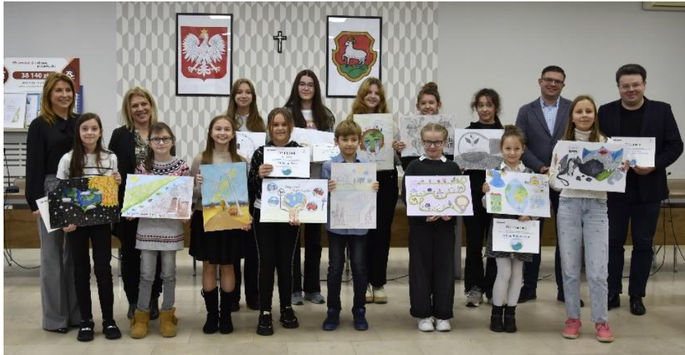
Laureaci konkursu plastycznego pt. „Odnawialne źródła wykorzystamy, zmiany klimatu powstrzymamy.”

PWiK Piaseczno regularnie organizuje i wspiera liczne inicjatywy w obszarze kultury, sportu i edukacji, budując trwałe relacje z mieszkańcami. Prowadząc kampanie społeczne oraz organizując coroczne konkursy plastyczne dla dzieci i młodzieży Spółka przyczynia się do poszerzenia świadomości ekologicznej.