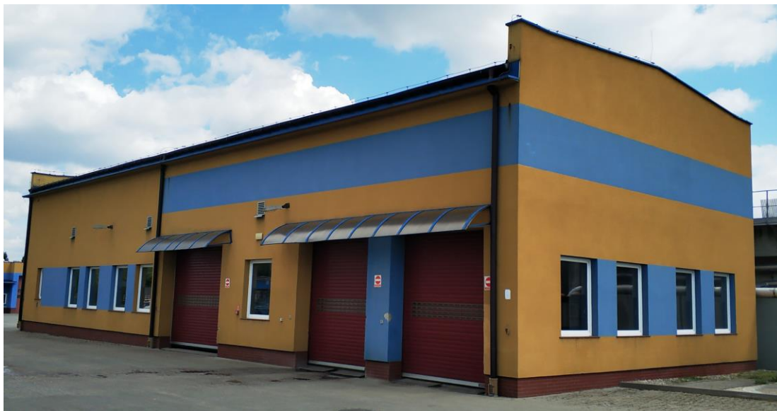
Widok na elewację południowo-zachodnią budynku.