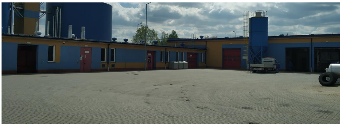
Widok na elewację północno zachodnią.