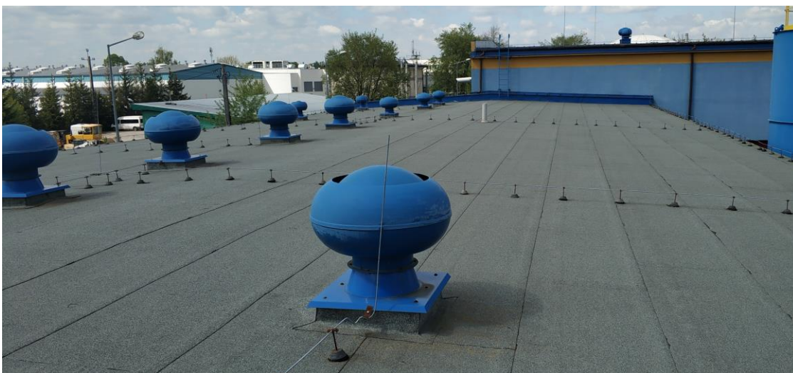
Widok dachu –segment południowy dochodzący do budynku instalacji suszenia odpadów ściekowych.