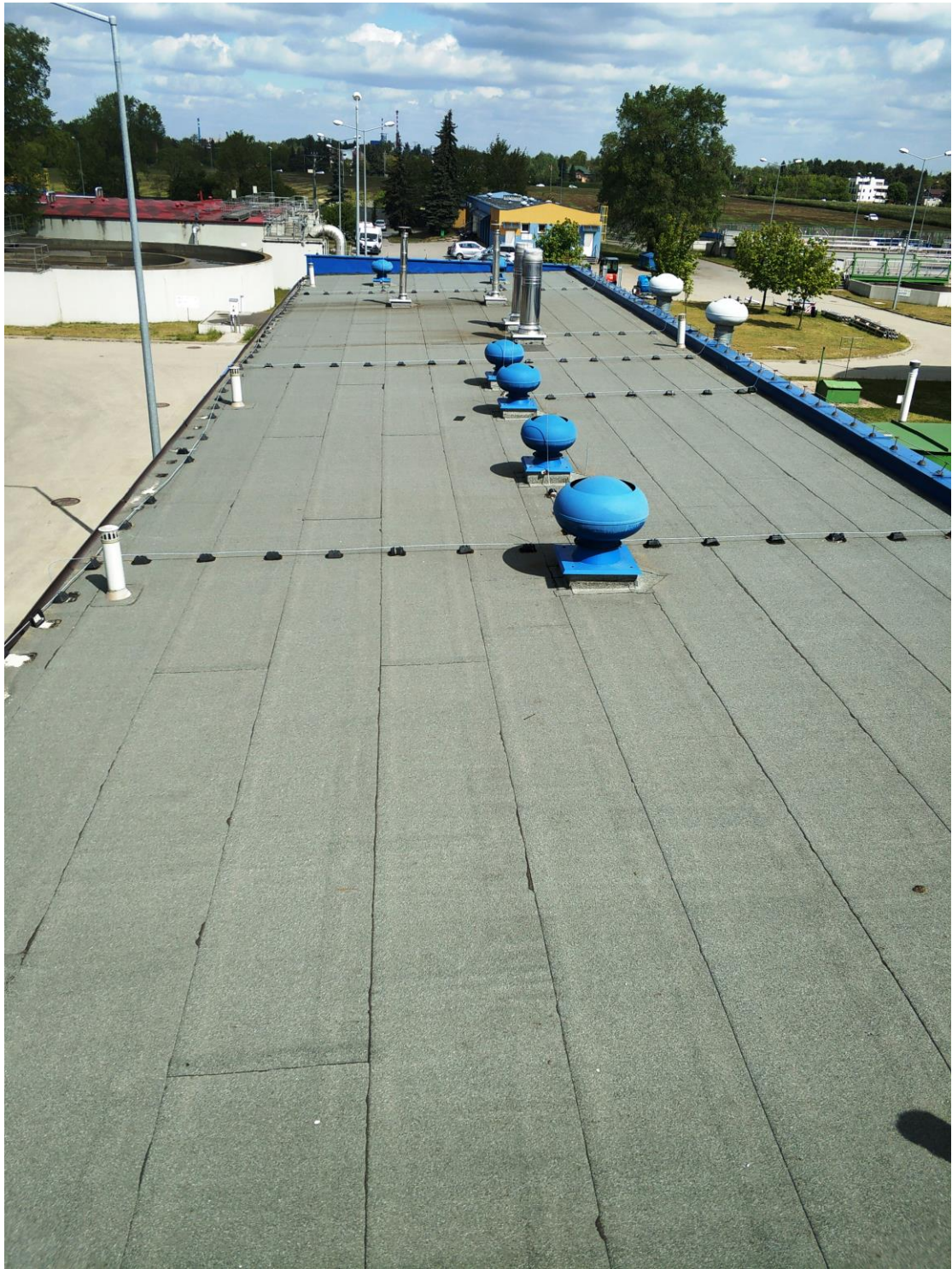
Widok dachu –segment północny.