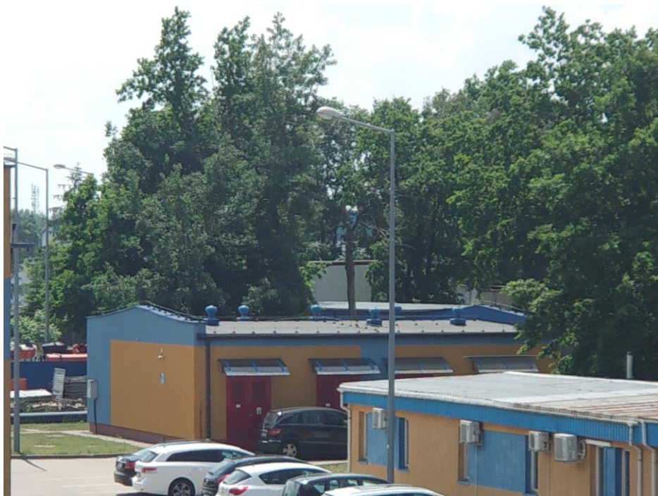
Widok na elewację północno-wschodnią budynku.